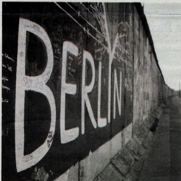
Une exposition en noir et blanc sondant la capitale allemande.